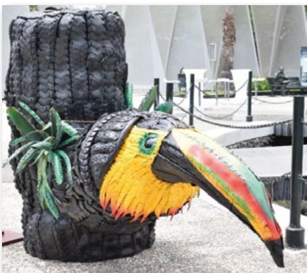
Obra Es vida | Artista Luis Valencia

ción de este material para la elaboración de diferentes esculturas, entre las técnicas usadas para la elaboración de las obras están el ensamblaje de caucho reciclado, ensamblaje hueco relieve y corte de caucho neumático.