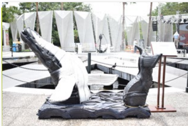
Obra Éxodo | Artista Kevyn Duque